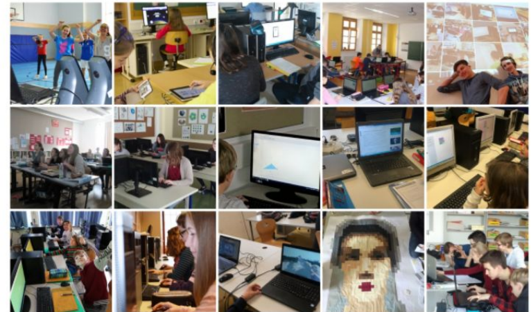
Schaufenster der Aktivitäten